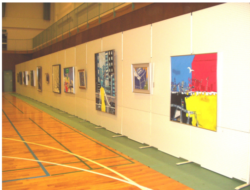
< 作品展風景 >