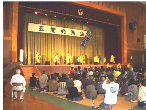
< 芸能発表会の模様 >