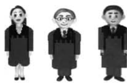
これまでの刑事裁判