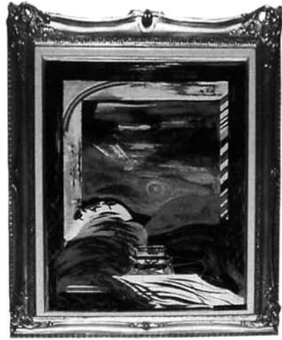
〈艶景 良寛〉角卓 20号

寄贈絵の作家・角卓について紹介しますと、昭和3年香川県高松市で出生、武蔵野美術学校卒業後関西光風会最高賞受賞(21歳)、光風会展特別賞受賞・13回日展特選(29歳)、日展無鑑査・光風会会員(30歳)、35歳~48歳にかけて4回渡欧し、有名画家に師事し、調査研究をしています。また、日本美術家連盟会員、光風会展審査員、日展審査員・同会員・同評議員、甲南女子大学教授に就任しています。平成11年逝去(71歳)しています。出展は国内に留まらずパリ国際サロン展招待出品、モントリオール国際展特別出品等があり、兵庫県文化賞、神戸市文化賞、高砂市文化賞を受賞しています。特異な作品として高松市番町地下道の壁画、大阪駅ターミナルビル中央コンコースの大壁画を製作しています。作品は国内のみならず海外でも高く評価されておりニース美術館、ピカソ美術館にも収蔵されています。