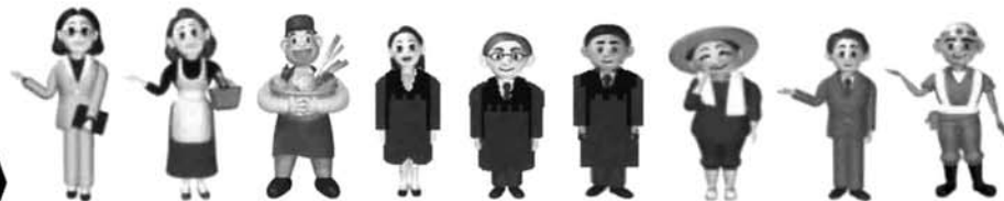
裁判が身近でわかりやすいものになる。司法に対する国民の信頼が向上する。