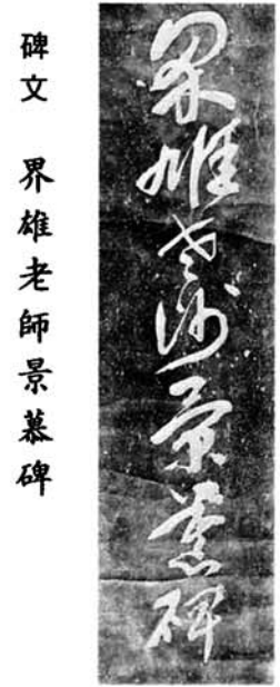
碑文 界雄老師景慕碑