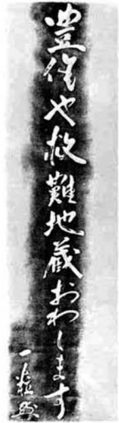
碑文 豊作や救難地藏おわします