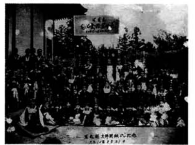
大佛開眼式記念 稚児