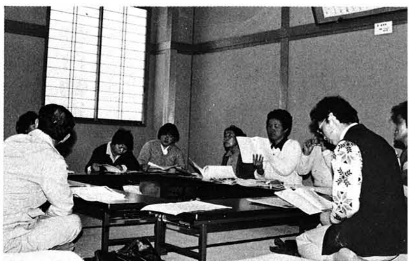
つたのではないかと悔やまれます。

整枝の方法を教えていただきましたが、枝が伸び過ぎてからばかり摘んだので、そうとうつるが弱