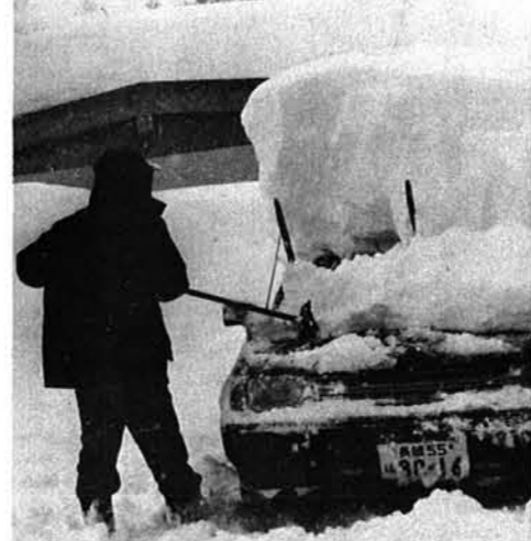
1月10日朝、これが1晩の雪。車の上に1mあまり積もった。