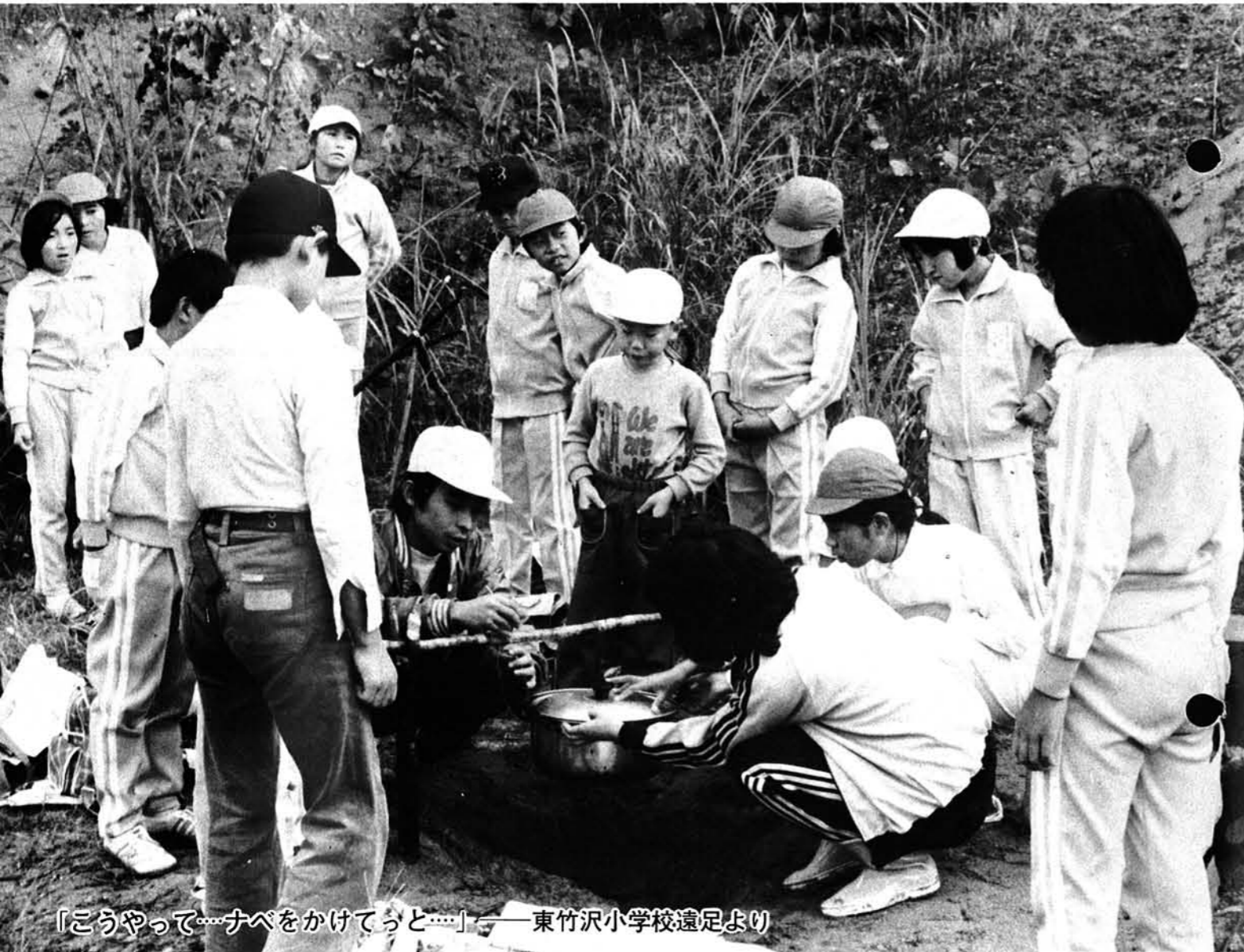
「こうやって…ナベをかけてうと…」—東竹沢小学校遠足より

期日 11月8日(水) 時間 9時～14時 区域 山古志村全域 東北電力山古志出張所の新築工事に伴い、場所が移転していましたが、このほど完成し、11月1日より従来どおり役場のとなりで営業を開始します。 一東北電力小千谷営業所一