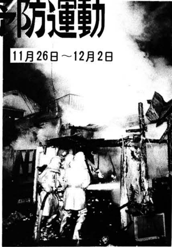
『それぞれの持場で生かせ火の用心』