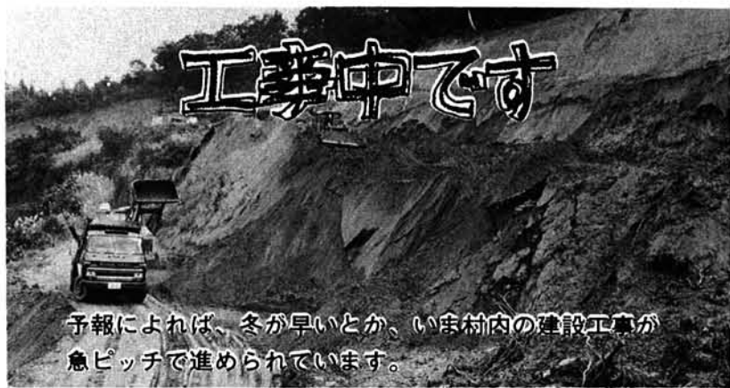
予報によれば、冬が早いとか、いま村内の建設工事が急ピッチで進められています。

税務相談室長岡分室 長岡市南町二丁目九十一 長岡税務署内 電話 長岡(三三)五五二一