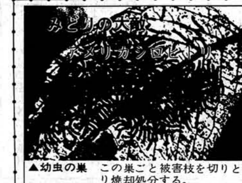
▲幼虫の巣 この巣ごと被害枝を切りとり焼却処分する。

毎年このころながら梅雨期の後半から八月にかけて豪雨に見舞われ被害を受けております。ことしも長期予報から見ると大雨の懸念があり被害が予想されますので地すべり兆候の早期発見などに充分気を配り、災害防止のためお互が注意いたしましょう。 本村は、各地に地すべりの指定地があり、現在すべりすべりしている区域、過去にすべりしたことの区域などが多くあります。しかも養魚池が増加し、池水が地下に浸透するなどいつそその危険性がふえていくといえましょう。 降雨時は地盤はゆるみ、地すべりが、がけくずれが発生しやすい状態になります。人命を災害から守り、耕地の欠損などを未然に防ぐため日頃の防災体制を整えておきましょう。 ○ 現在すべっている区域、過去にすべったことのある区域はとくに厳重に警戒する。 ○ 常に該当箇所を巡視し、地すべり区域頭部にき裂が生じていないかを注意する。 ○ わき水箇所や井戸水の水量が変化して異常に濁っている場合、また地鳴り、家鳴りがするようときは危険である。 ○ 横ボーリング排水が急に止まったり、濁ったりした場合は危険である。 以上の注意点については、発見が遅れがちとなりますので注意を怠らないことが大切です。