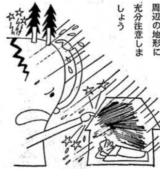
豪雨シーズンです 周辺の地形に 充分注意しま しょう

毎年このころながら梅雨期の後半から八月にかけて豪雨に見舞われ被害を受けております。ことしも長期予報から見ると大雨の懸念があり被害が予想されますので地すべり兆候の早期発見などに充分気を配り、災害防止のためお互が注意いたしましょう。 本村は、各地に地すべりの指定地があり、現在すべりすべりしている区域、過去にすべりしたことの区域などが多くあります。しかも養魚池が増加し、池水が地下に浸透するなどいつそその危険性がふえていくといえましょう。 降雨時は地盤はゆるみ、地すべりが、がけくずれが発生しやすい状態になります。人命を災害から守り、耕地の欠損などを未然に防ぐため日頃の防災体制を整えておきましょう。 ○ 現在すべっている区域、過去にすべったことのある区域はとくに厳重に警戒する。 ○ 常に該当箇所を巡視し、地すべり区域頭部にき裂が生じていないかを注意する。 ○ わき水箇所や井戸水の水量が変化して異常に濁っている場合、また地鳴り、家鳴りがするようときは危険である。 ○ 横ボーリング排水が急に止まったり、濁ったりした場合は危険である。 以上の注意点については、発見が遅れがちとなりますので注意を怠らないことが大切です。