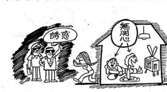
非行は親の無関心から

いるか。 ○ 休憩時間は十分にとつてあるか ○ 海水浴や観光に伴う疲れを計算に入れてあるか。 ○ 睡眠時間を考えない深夜・早朝の運転を計算していないか。 ○ 体の不調なときは運転をひかえよう ○ 運転者の疲労は、体力の消耗より神経の消耗の方が原因の多くを占めていると言われます。 ○ 睡眠不足で、自分でも疲れが感じられる。 ○ 体がだるい。 ○ 頭がボンヤリしている。 ○ 目がチラチラする。 ○ 目や鼻が乾燥している。 ○ 肩や腕が重たい。 ○ 深呼吸をする。 ○ 肩をたたいたり、まわしたりするなど軽い運動で疲れをとるくふうをしましょう。 ○ 早めの休けいで疲れを防ごう ○ 居眠り運転で交通事故を起こした運転者から…… ○ 駐車場へ入って休もうと思つたのに…… ○ 休むのに適当な場所を探していたのに…… ○ もう少しで目的地へつくからと思つていたのに…… ○ というような後悔の言葉が聞かれます。 ○ 事故を起こしてからでは、もう間に合いません。体に異常を感じたら、早めに休憩しましょう。 (交通安全キャンペーンより)