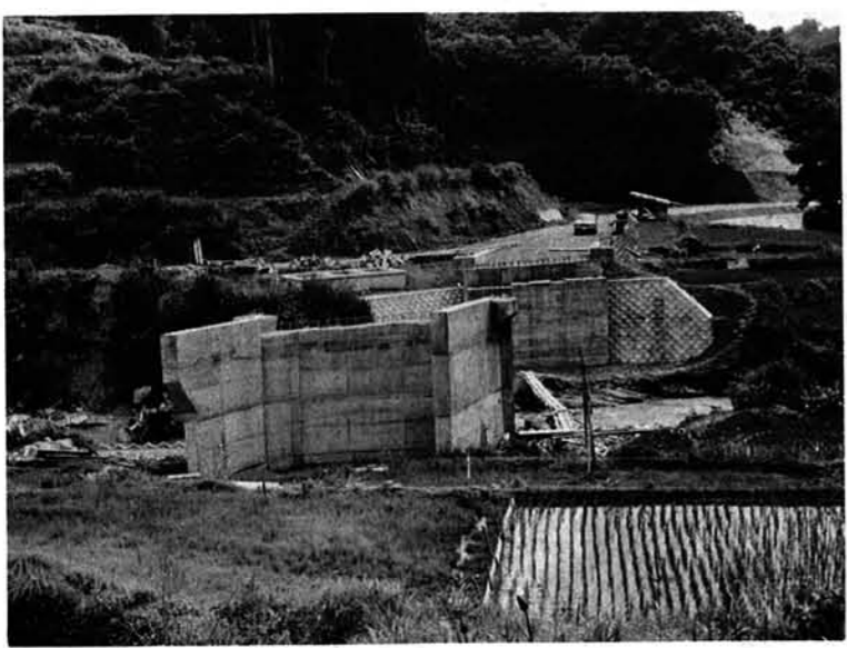
昭和50年度実施予定の公共土木事業概要

滝野林川（虫亀）、芋川（池谷）の堰堤工を継続して実施し、朝日川（向田）の地下取水ボーリング集排水工を、芋川（中野）では水路ボーリングが予定されています。 なお、公共事業を補完するためには、公共事業を補完するためには、費用によって小千谷栃尾線の改修など六ヶ所において工事を実施することになっております。 道路整備による交通の確保は地域発展のための重点施策でもありますので、事業実施にあたっては円滑にできるよう関係者の協力が望まれています。