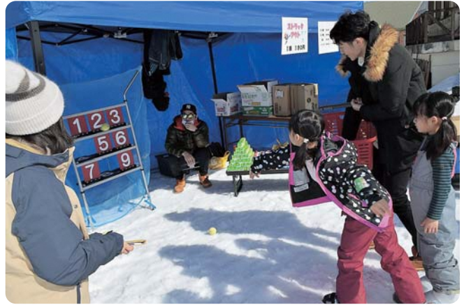
▲ストラックアウト

冬の恒例イベント「古志高原スキーカーニバル」が今年も行われ、春を思わせる陽気の中、市内外から約1,000人が訪れました。ストラックアウト、つきたてお餅のふるまいやグルメテントで賑わい、中でも豪華景品が当たる「お楽しみ抽選会」では、抽選番号が読み上げられるたびに大きな歓声が上がっていました。