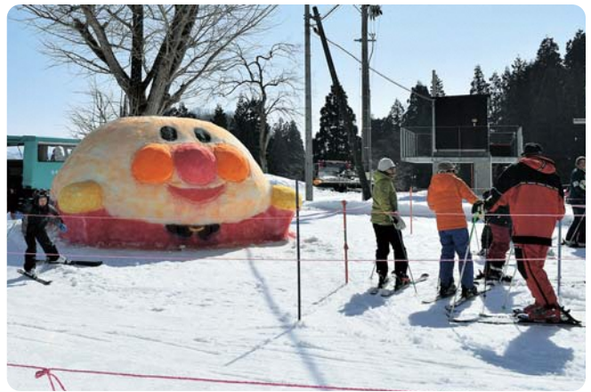
▲雪像のアンパンマン