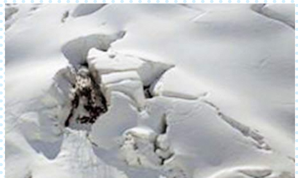
▲クラック（雪の裂け目）

3月・4月は、就職や進学等で住所を移転する方が多くなりますので、住所異動手続きはお早めにお願ひします。