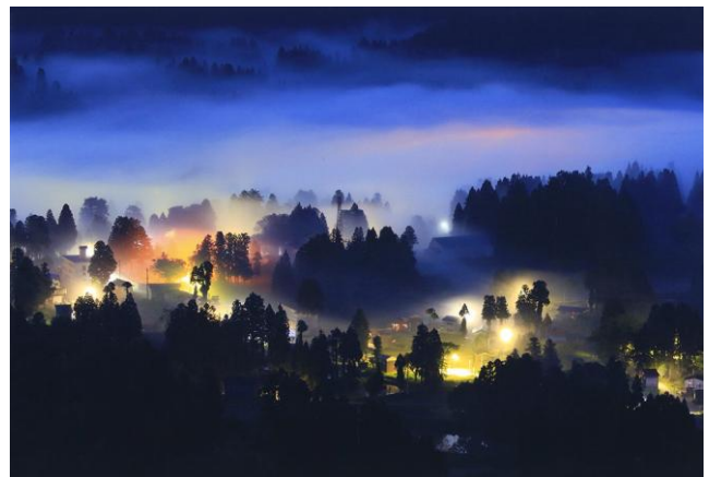
▲特別賞・新潟県知事賞