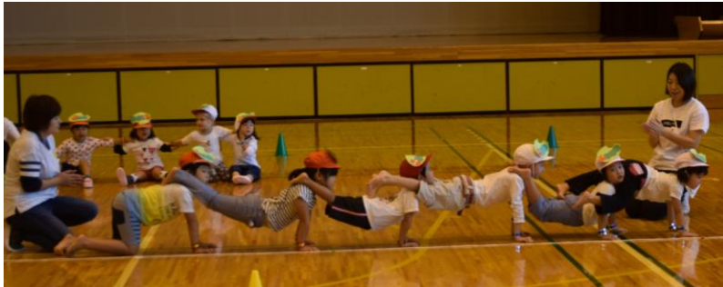
▲たけ・さくら組の組体操「一本橋」

園児たち11名による、「オープニングダンス」で始まり、かけっこや障害物レースなどに挑戦する姿に大きな拍手と声援が送られていました。親子ふれあい遊びでは、園児たちは大好きなお母さん、お父さんと一緒にたくさん体を動かし笑顔を見せていました。