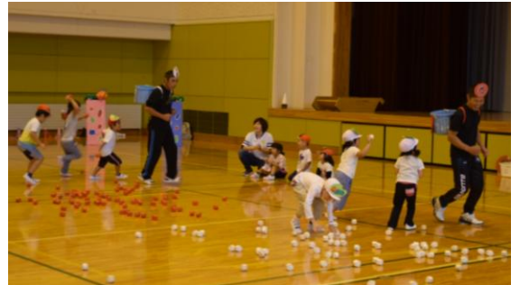
▲追いかけて玉入れ