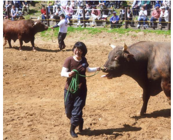
▲推薦・長岡市長賞