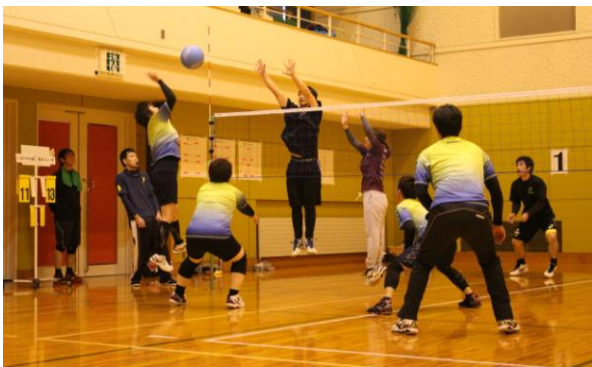
◀ 昨年のソフトバレーボールの様子

申込み：1 チーム 5 人以上で 10 月 26 日（金）までにお申し込みください。