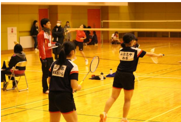
◀ 昨年のバドミントン交流大会の様子

※申込み方法については、下記までお問合ください。 総合型クラブ Y-GETS（☎ 59-3070）