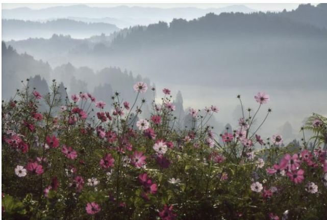
▲特選・毎日グランプリ