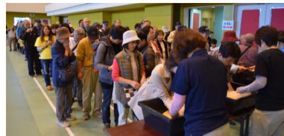
◀ 昨年の新米つかみ取りの様子

※農作物品評会に出品してください(詳細は、後日チラシを配布しますのでご覧ください)