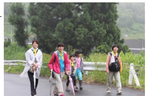
平成29年度サンセットウォークの様子