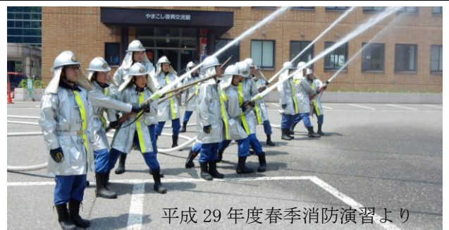
平成29年度春季消防演習より