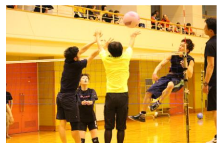
平成29年度ソフトバレーボールの様子