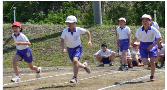
平成29年度のと競走の様子