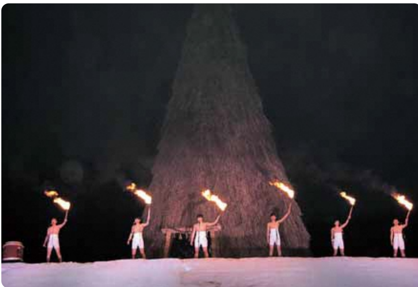
▲新成人によるさいの神点火式