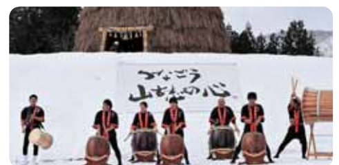
▲オープニングセレモニー