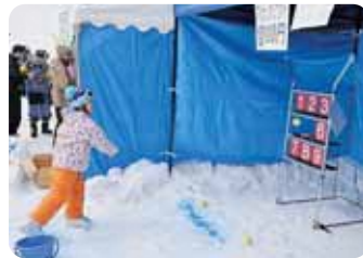
▲ストラックアウト