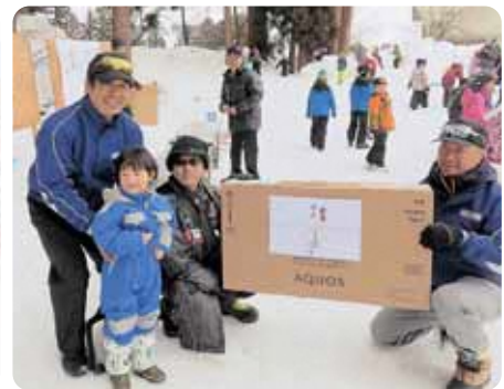
▲液晶テレビが当たった市内の親子