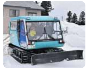
▲雪上車の試乗体験会