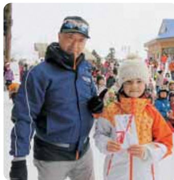
▲ディズニーランドペアチケットが当たった小学生