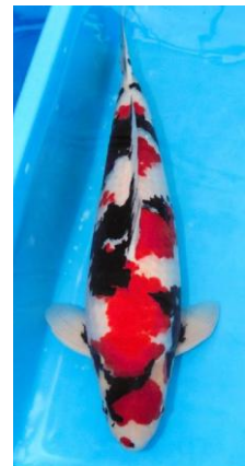
壮魚オスの部総合優勝・第70部 昭和三色 丸重養鯉場（虫亀）