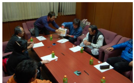
▲スタンプラリー抽選の様子