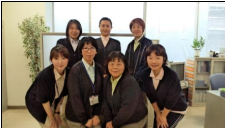
「地域包括支援センター みやうち・やまこし」 のみなさん

長岡市から委託を受けた公的相談窓口です。65歳以上の方が住み慣れた地域で安心して暮らせるように、常駐の保健福祉専門職が、山古志支所、診療所、民生委員などの関係機関と連携しながら、個人情報に配慮した上で、以下の業務を行います。