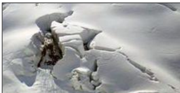
クラック（雪の裂け目）

降雪・積雪の増加に伴い、なだれ・雪害の危険性が高まります。特になだれについては、十分に注意してください。下の写真のようなクラックや巻きだれ、雪庇などの兆候などを見つけたら、危険な場所を避け身の安全を確保し、場所や様子を下記担当へご連絡ください。また、除雪作業中の事故の危険性も高まりますので、気をつけて作業をお願いします。