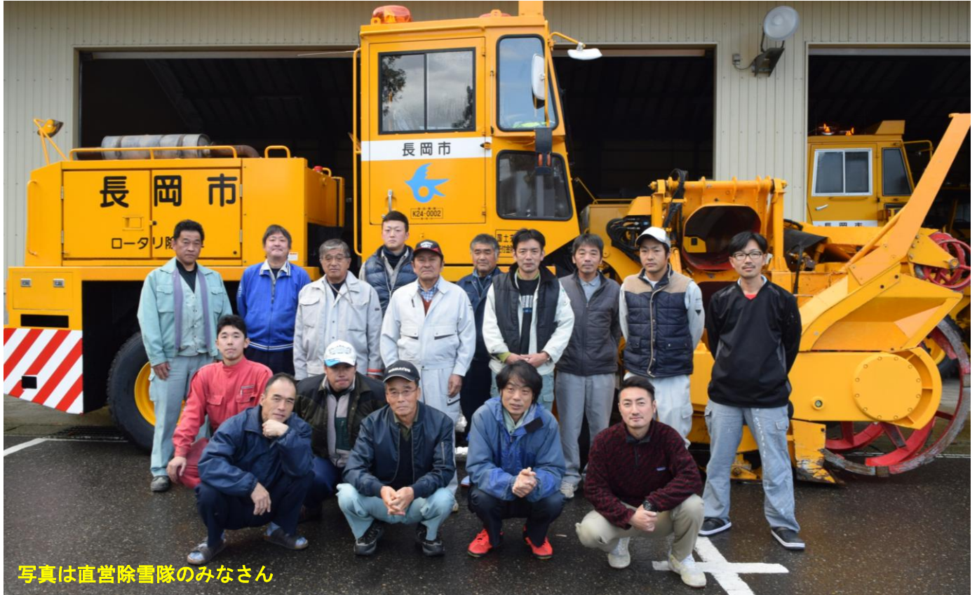
写真は直営除雪隊のみなさん