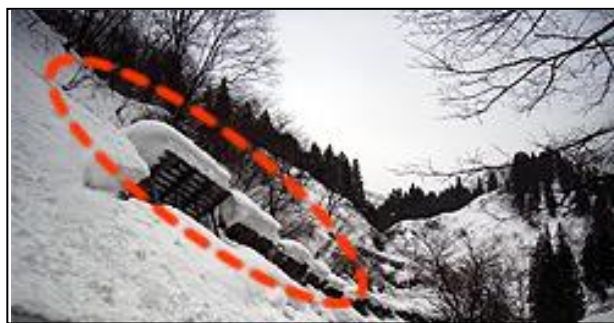
なだれ予防柵からの巻きだれ