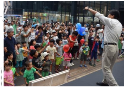
▲昨年のやまこしフェアの様子

当日は、8:45に支所前から会場 行きの無料クローバーバスを運 行しますのでご利用ください。