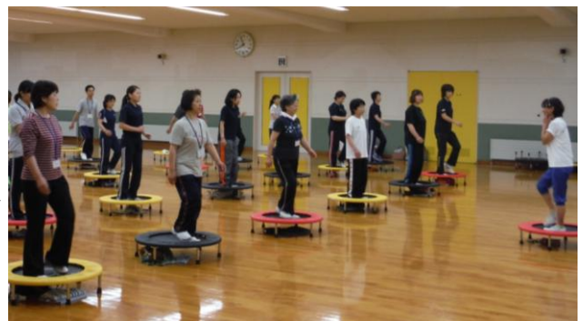
▲やまこし多世代健康づくりセミナーの様子