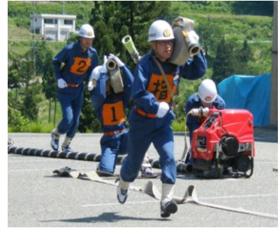
▲小型ポンプ操法の様子