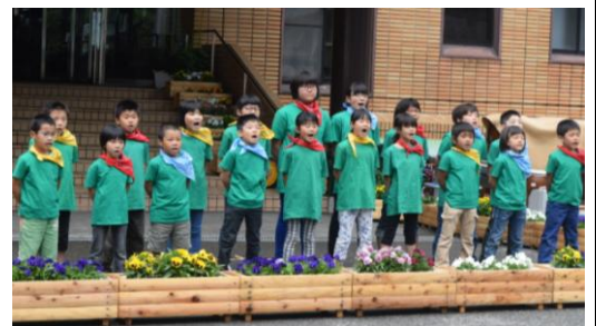
▲オープニングは小学生による「天神ばやし」