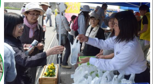
▲来場者には山古志の復興の象徴である「ひまわり」をプレゼント