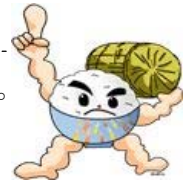
「長岡うまい米キャラクター」まんまくん