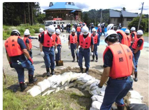
いざというときに備え、日ごろから訓練をしています。7月6日に行われた水防訓練の様子。