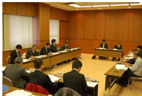
←第6回山古志地域委員会の様子