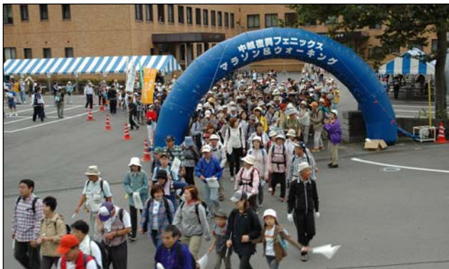
↑ 昨年の「山古志ウォーク」スタート。約900人が参加 (担当：地域振興課地域振興・防災係 ☎ 59-2330)