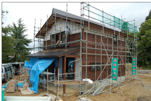
今回完成する復興住宅低床基本モデル。