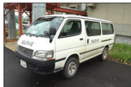
コミュニティバス。

経路上で、手を挙げていただければ、どこからでも乗車できますし、運転員に下車を希望すればどこでも停車します。