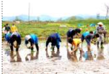
↑慣れない手つきで田植え

5月13日、山古志地域と青葉台地区の交流を図ろうと青葉台山古志応援団の皆さんの呼びかけで田植えが行われました。青葉台の田んぼに餅米の苗を手で植えていましたが、最初は手間取っていましたが、皆さんの指導のもと上手に植えることができました。秋には収穫し、餅つきやさいの神などの交流が予定されています。