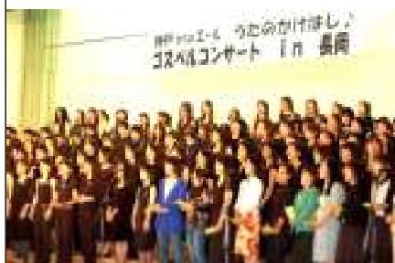
↑総勢230人による大コーラス

4月29日、青葉台小学校で「うたのかけはしゴスペルコンサート in 長岡」が開催されました。これは同じ震災を経験した神戸を中心とするグループが、元気な歌声を届けたいという気持ちから行われたもの。コンサートでは14グループ 160名の力強い歌声が会場を魅了。コンサート後半には、山古志中学校生徒等が加わり、総勢230人の大コーラスで熱唱、大きな歓声が上がっていました。