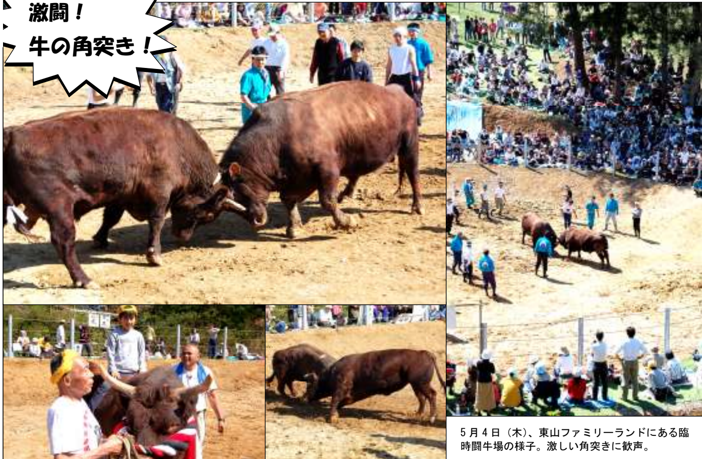
5月4日（木）、東山ファミリーランドにある臨時闘牛場の様子。激しい角突きに歓声。