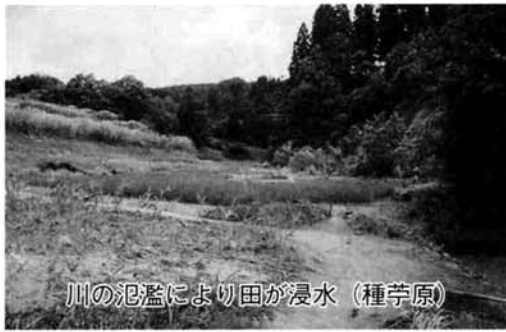
川の氾濫により田が浸水 (種芋原)