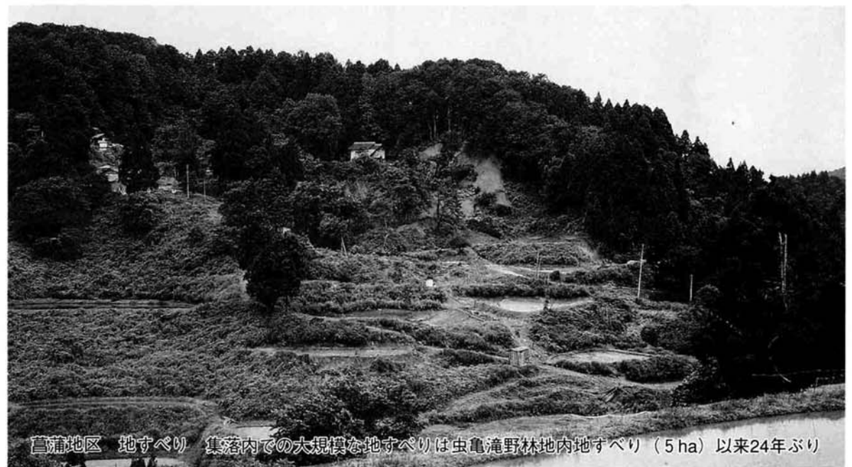
菖蒲地区 地すべり 集落内での大規模な地すべりは虫亀滝野林地内地すべり(5ha)以来24年ぶり

しました。(7月22日現在で3世帯避難) 梅雨明けした現在でも予断を許さない状況となっております。