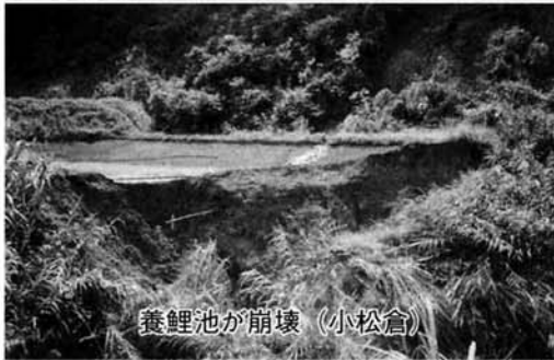
養鯉池が崩壊 (小松倉)