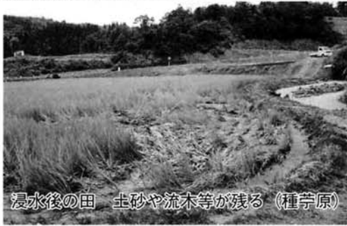
浸水後の田 土砂や流木等が残る (種芋原)