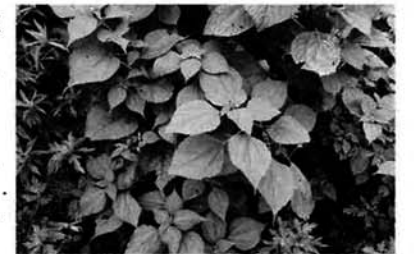
村内に自生するからむし