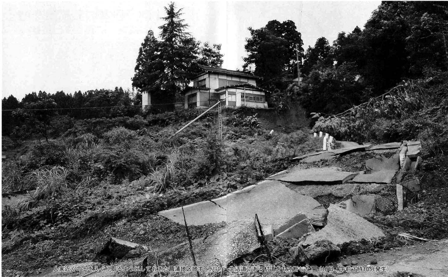
人家近くの土をえぐり取るようにしておきた菖蒲地区地すべりは生活道である村道をも寸断した。(18日 午前3時10分発生)

農地や農道・村道などの土砂崩れのほか養鯉池などの土手が崩れ錦鯉が流失する被害も起き、種芋原地区では川が氾濫し周辺の水田が浸水しました。水が引いた後も流木等の漂着物や土砂などが残り秋の収穫に影響をもたらす事が懸念されます。