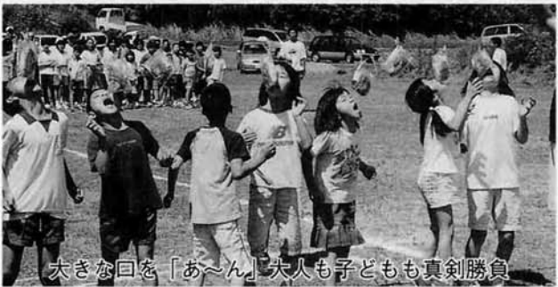
大きな回を「あ〜ん」大人も子どもも真剣勝負