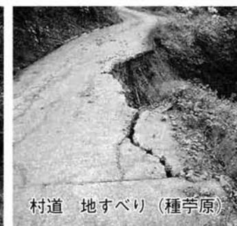
村道 地すべり (種芋原)