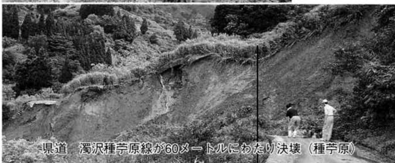
県道 濁沢種芋原線が60メートルにわたり決壊 (種芋原)