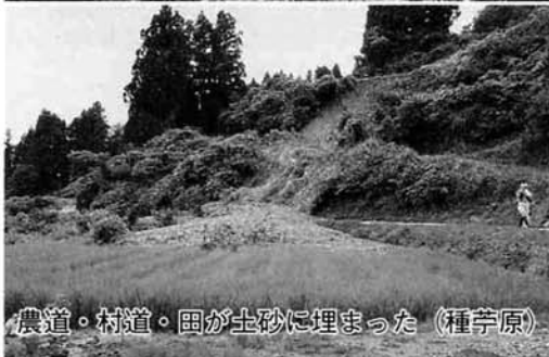
農道・村道・田が土砂に埋まった (種芋原)