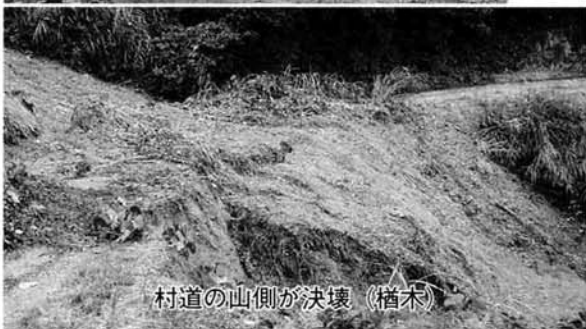
村道の山側が決壊 (橋木)