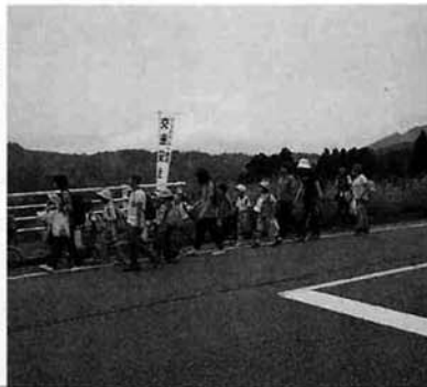
仲良く手をつないで遠足

その後一、二年生は桂谷方面へ遠足、三、四年生はトン汁作り、五年生はタカノファームへ見学、六年生は下の学年の補佐役として分かれ、それぞれの趣向を凝らした中身の濃い交流会が進められました。