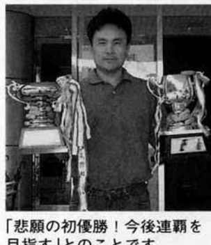
「悲願の初優勝！今後連覇を目指す」とのことです。