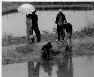
錦鯉も名演技を披露

二日からの放送となる予定です。全国の方に「山古志村の闘牛と錦鯉」を知っていただけるよい機会、放送が今から楽しみです。撮影に参加していただいた皆さん、ご協力本当にありがとうございました。