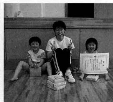
準優勝 「御令室」代表