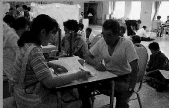
「体の調子はいかがですか?」

住民の健康づくりと病気の早期発見を目指し基本健診が六月五日から四日間各地域に分けて行われました。身体測定、血圧測定、医師の問診等によって、健康状態をチェックされます。検査結果が異常なしでも体に異変をきたしたら、いち早く検査し治療をしてください。また基本健診以外の各種検診や相談会を利用して健康維持に努めましょう。会場では山古志村食生活推進委員会さんおすすめの「健康メニュー」二品の試食もおこなわれ、食生活からの健康への取り組みも紹介されました。