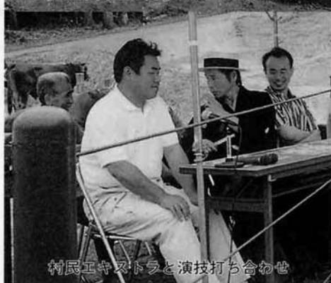
村民エキストラと演技打ち合わせ