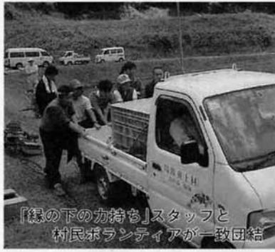
「縁の下のかたち」スタッフと村民ボランティアが一致団結

闘牛と錦鯉の指導、撮影場所の提供等、村内の方々から多大な協力を受け、また近隣市町村からも、たくさんの方が応援に駆けつけてくれました。NHKスタッフからも、「今回のロケでも村の皆さんにたくさんのご協力をいただき、感謝しています。おかげさまでいい映像が撮影できました。ドラマで登場するのを楽しみにしていただき。」とのコメントをいただきました。