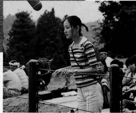
多数のエキストラが参加し、出演者、スタッフを交えて迫力の闘牛シーンを再現!

この会場につめかけました。長岡市から参加の女性グループからは「山古志村のお友達からロケの事を聞き参加しました。こ