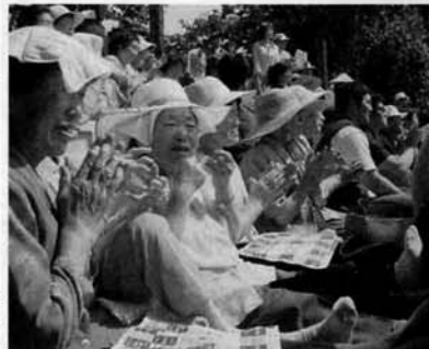
エキストラの大熱演!

闘牛と錦鯉の指導、撮影場所の提供等、村内の方々から多大な協力を受け、また近隣市町村からも、たくさんの方が応援に駆けつけてくれました。NHKスタッフからも、「今回のロケでも村の皆さんにたくさんのご協力をいただき、感謝しています。おかげさまでいい映像が撮影できました。ドラマで登場するのを楽しみにしていただき。」とのコメントをいただきました。