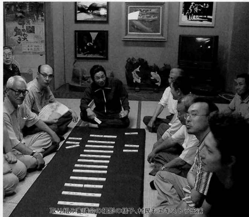
取材組の審議会の撮影の様子、村民もエキストラ出演