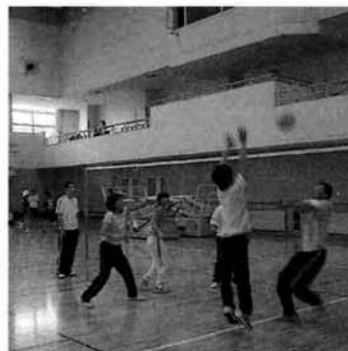
バドミントンの小さなコートで迫力の戦い