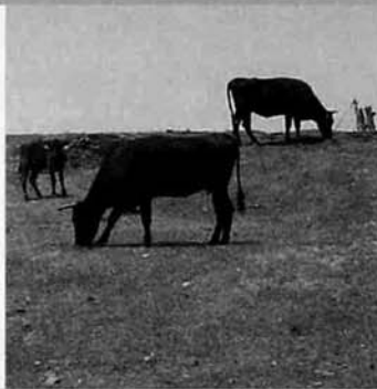
秋には成長した姿を見られるでしょう

今年も五月三十日(金)に牛の放牧が萱峠牧場でおこなわれました。上牧されたのは親牛二十二頭、子牛が八頭の計三十頭です。BSE問題等で牛肉に対する不安等がささやかれています。安全でおいしい牛肉を目指して、肥育牛の育成が行われています。