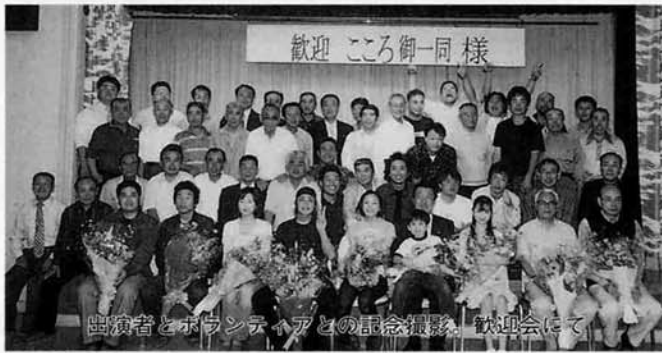
出演者とボランティアとの記念撮影。歓迎会にて

二日からの放送となる予定です。全国の方に「山古志村の闘牛と錦鯉」を知っていただけるよい機会、放送が今から楽しみです。撮影に参加していただいた皆さん、ご協力本当にありがとうございました。