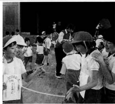
旗を振ったら「ジャンケンポン」

六月十六日(月)山古志村小学校で長岡聾学校との交流会がおこなわれました。聾学校児童十三名と山古志小学校全校児童八十三名の歓迎の集いでは、山古志小学校長先生から「この交流会で素敵な思い出を作ってください。」とあいさつがのべられました。全体のゲームではさっそくうちとけて遊ぶ場面が見られ、クイズ大会では「聾学校の運動会は赤が優勝した。○か×か?」という問題に「どっちが勝ったの?」とあちこちで元気な声が飛びかかっていました。