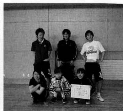
優勝 「チームゲンボー」