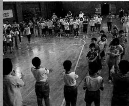
「小さな世界」合唱 手前に聾学校児童

昼食後は、全体でお別れの会が開かれ、聾学校児童の「楽しかった。また交流したいです。」と一生懸命手話で話す姿に会場を計画した山古志小学校の児童も満足の笑顔を覗かせていました。最後には聾学校の児童の手話を手本に「小さな世界」が歌われ、大きな動作の手話と声で体育館に響き渡る大合唱となりました。今後このような交流が進められ山古志小学校の世界もどんどん広がっていくとよいですね。