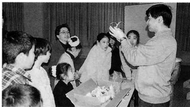
これは、何の種か知っていますか

最後の第四部は、科学の神秘を探る! 科学実験教室が村民会館で行われました。講師に魚沼・小千谷地域理科センター専任所員の青柳さんを招き、植物の種の飛び方をビデオや実際に青柳さんが採取したものをを使い、様々な形と飛び方を学びました。種の飛び方も様々で、丸い種もあれば葉っぱのような物もあり飛び方もただ下に落ちるだけのものもあれば、風に乗ってど