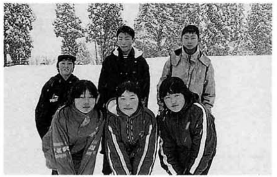
男女リレー1位のみなさん