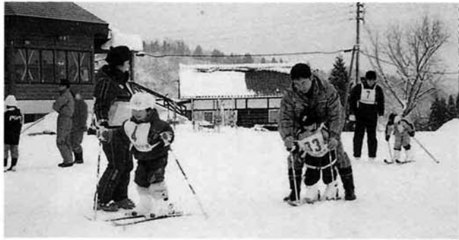
お父さんと一緒に楽しくスキーに乗りました

一月二十二日(土)から五週連続五回親子スキー教室が古志高原スキー場で行われました。 幼児と小学生及びその保護者を対象に行われたスキー教室でしたが、子供たちの上達ぶりはとても早く、歩くことすら親に手を引かれてやつの様子の子ども自分で歩けるようになったり、緩い傾斜を滑ることが出来るようになったりしました。 なかには、保育所の園児がリフトに乗ってゲレンデを滑れるとの話も聞き驚きました。