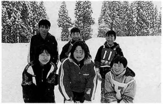
男女1位のみなさん