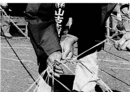
さすが!見事な手さばき

—縄ない選手権大会— 制限時間内に縄の「長さ」と「出来ばえ」を競う「縄ない世界選手権大会」に十一チームが出場しました。 縄をなう機会がないにも関わらず、参加者は昔を思い出しながら「早く!」「長く!」「きれいに!」縄をなっていました。 優勝は、長さ十三・八m(四十一・四点)出来ばえ四十二・八六合計八十四・二六点を獲得した「ザのーい」が二年連続の優勝でした。