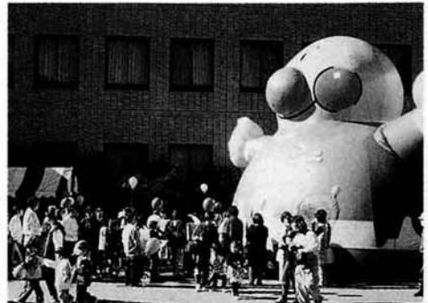
大人気のアンパンマンのフワフワ