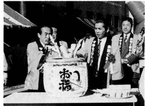
品評会には農家が丹精込めて作った米・大豆・白菜等が一八八点出品され、金賞受賞者は表彰式で表彰されました。

—第二十三回産業まつり— 農産物産品評会と特産品の即売を行う産業まつりが十一月三日、役場前を会場に行われ約五千二百人が来場しました。