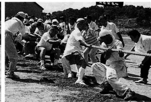
選手も応援も力が入りました