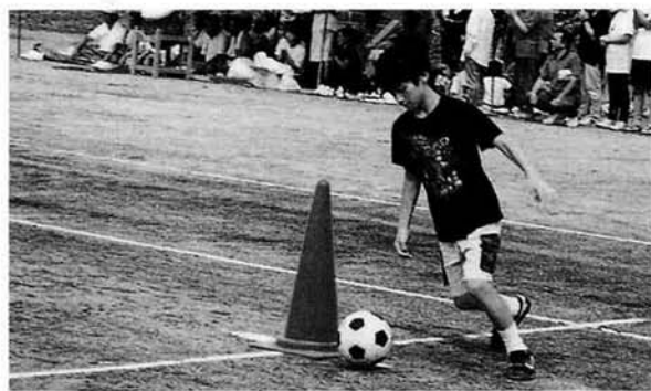
すばらしい足さばきが見れました