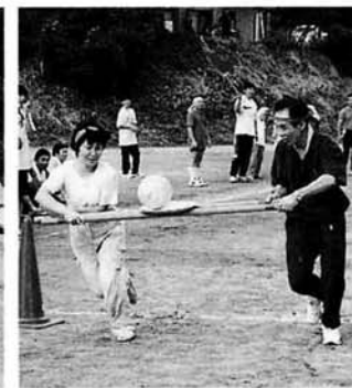
心を合わせてがんばりました