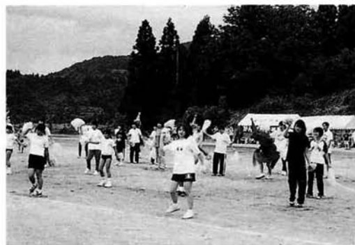
応援賞 東竹沢分館