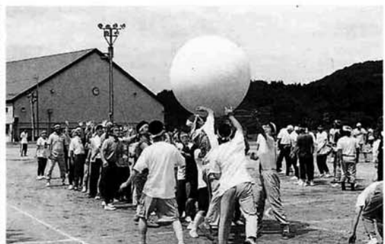
大玉おくりも楽しめました