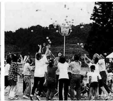
皆で力を合わせ玉入れ