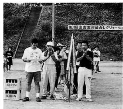
総合優勝 池谷分館