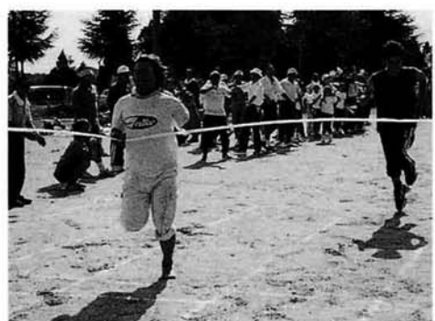
男子リレー 1位 東竹沢分館