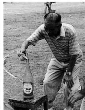
あわてないで慎重に