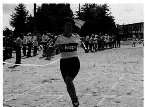
女子リレー 1位 虫亀分館