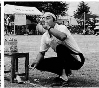
朝一番からおいしいラムネ