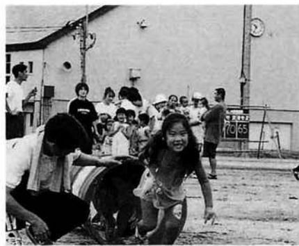
幼児レースも大好評