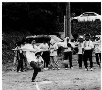
ホームランをねらってキックベース