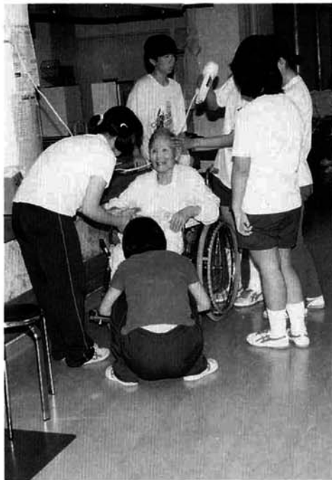
中学生サマーワークキャンプ ～2泊3日のボランティア活動～

編集発行・社会福祉法人山古志村社会福祉協議会（なごみ苑内）電話 0258(59)2080