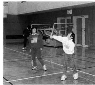
大健闘の星野ファミリー