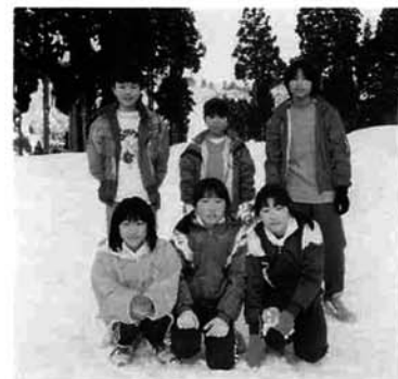
男女リレー優勝チーム