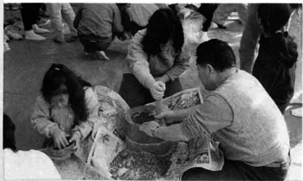
石うすを使っての粉ひき

二月二十一・二十二日にえちご長岡地酒塾が行われ、県外から十一人の方が参加しました。餅つき・雪明かりづくり・わら細工・雪上車の試乗体験・手打ちそばの体験・特産錦鯉の鑑賞等内容が盛り沢山の企画に参加者は大喜び。どれをとってもはじめての経験だったようです。お福酒造での利き酒や雪遊びなど良い思い出を作ってくれたと思います。遊び・体験と参加者は、十分に山古志村を堪能して帰ったようです。