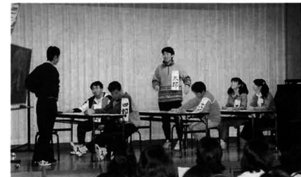
「現代版 十四の瞳」のワンシーン