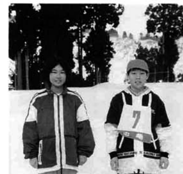
総合優勝をとったよ!