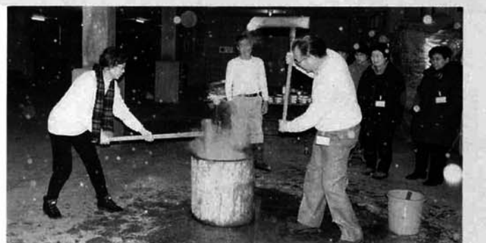
参加されたご夫婦による記念のもちつき

孫親学級そば作りが二月七日竹沢小学校で行われました。そば粉とふりを混ぜて悪戦苦闘しながら、手打ちそばにチャレンジしました。講師で参加された老人クラブのみなさんとおじいちゃん・おばあちゃんに手伝ってもらいながらおいしいそばが出来ました。児童・先生方・参加者は、自分で作ったそばに舌鼓を打ちながら楽しい孫親学級が和気あいあいのうちに終了しました。