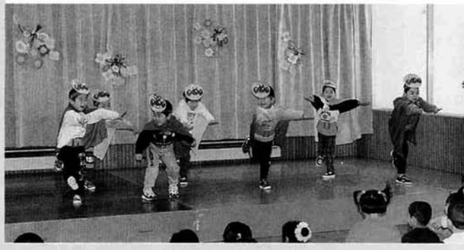
アンパンマンが勢ぞろい

サンタが保育園にやってきました! — 竹沢保育所 — 十二月十二日(金)竹沢保育所で、お楽しみ会が行われました。この日をめざして練習してきた歌・楽器の演奏・おゆうぎなどを発表してくれました。園児たちの楽しそうな顔がとても印象的でした。 また、サンタさんも元気な園児のところにプレゼントを山ほどもってきてくれました。 大歓声で迎えられたサンタさんはみんなの元気に大喜びしてプレゼントをみんなに配ってくれました。よかったね!