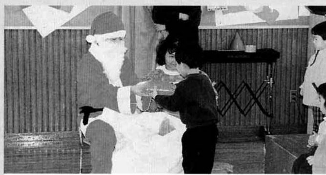
サンタさんありがとう

スキー場安全祈願祭 十二月十三日(土)に古志高原スキー場で安全祈願祭が行われ今シーズンのスタートが切られました。