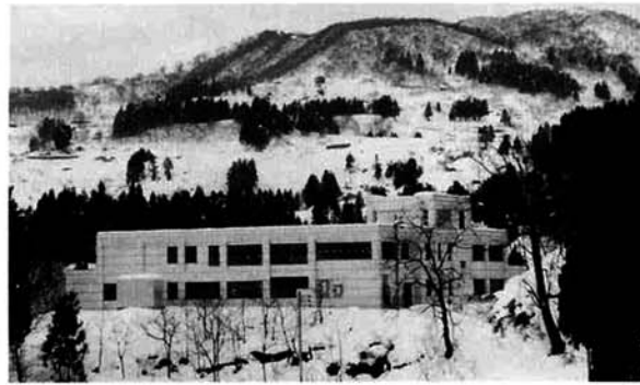
▲名前も決まり完成間近の『なごみ苑』

—地域福祉センター— 平成八年十一月号で公募しました地域福祉センターの名称がこのほど決まりました。 地域福祉センターの名称は「なごみ苑」に、風呂の名前は「まごめの湯」です。 七〇名の方々に応募いただき（福祉センター）一〇三点、風呂（九一点）、その中から決定したものです。