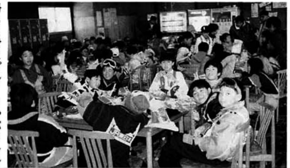
▲ゲームでスキースポーツ少年団と「ふれあい交流」