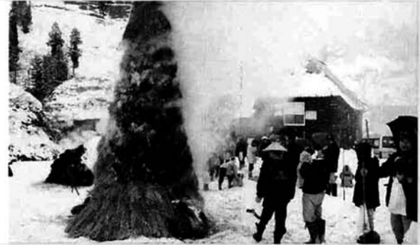
▲パチパチと音をたて煙と炎が舞いあがる榎木のさいの神