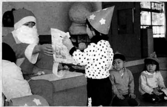
▲サンタクロースが「よいこ」にプレゼント!

十二月二十四日、種芋原保育 所でクリスマスパーティーが行 われました。 「サンタクロースがやってき た」の元気な歌声に迎えられて サンタクロースが登場すると、 子供たちの目がまん丸になりました。 瞬間と静かになりました。 サンタさんが「こんにちは、み んないい子にしてたかな」と声 をかける、「ハハイ」と大き な返事をしていました。 背中大きな袋からプレゼント トが一人一人に手渡されると、 握手したりだっこして記念撮影 するなど、すっかりサンタのフ ァンになっていました。