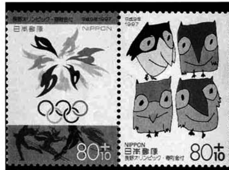
▲公式エンブレム（左）とマスコットのスノーレッツ

ような不満をお持ちの方は檢察審査会にご相談ください。相談や申立てについての費用は一切無料で、秘密は固く守られます。檢察審査会では、選挙権を有する一般国民の中から「くじ」で選ばれた十一人の審査員が、検察官が事件を起訴しなかったこと、のよしあしを審査します。詳しいことは、長岡檢察審査会事務局へ問い合わせてください。 長岡市三和3-9-28 新潟地方裁判所長岡支部内 ☎35-2141 二月二十六日（水）内科診療所、都合により休診します。