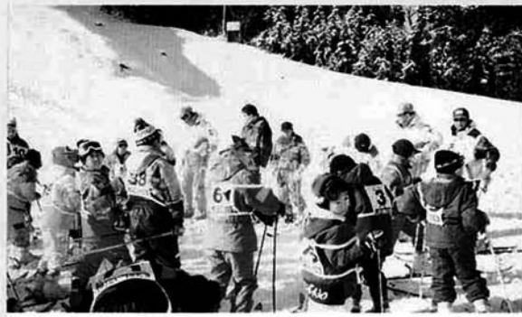
▲スキー教室に胸をはずます子供たち

長岡広域圏に県外客を誘客し スキー教室を通して市町村への 理解を深めてもらおうと「雪っ 子スキー塾」が、十二月二十六 日、古志高原スキー場を会場に して行われました。 「雪っ子スキー塾」は四泊五 日の日程で、首都圏から小学生 七十一名が参加しました。スキー は初めてという子供たちもあり、 ワクワクどきどきしながらのス キー教室。最初は思うようにス キーを動かせなかった参加者も レッスンによりメキメキ上達。