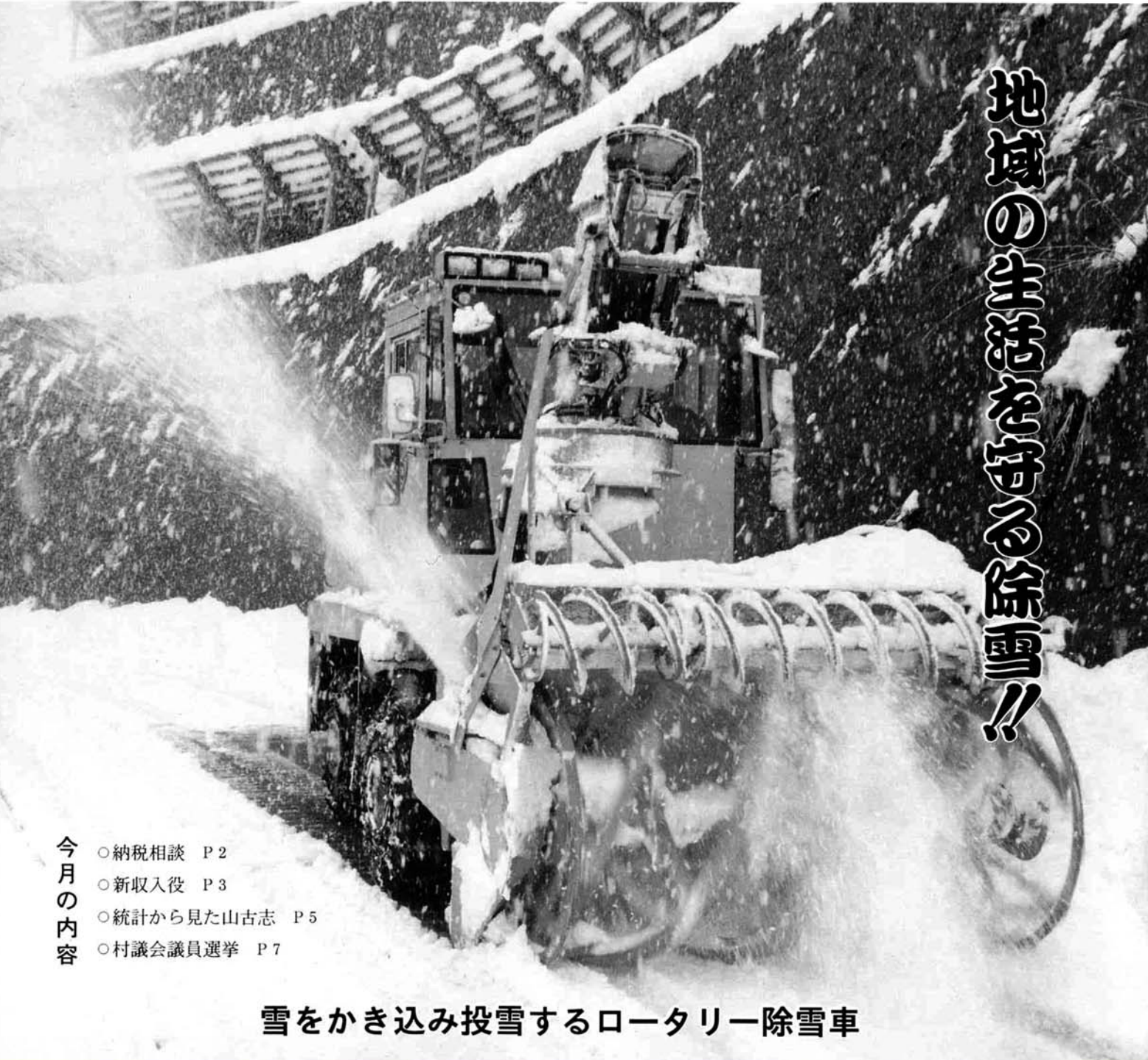
雪をかき込み投雪するロータリー除雪車