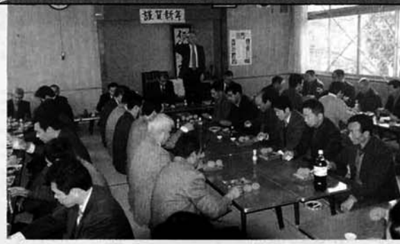
▲冷酒で乾杯/新年を祝う竹沢の皆さん

一月一日、竹沢集落の新年会が、集落センターで行われまし た。新年会には六十五名が出席し 記念撮影のあと祝宴に入りまし た。区長さんが代表して「新年 明けましておめでとうございま す。今年も明るい年であります ように・・・」と挨拶し、冷酒 で乾杯。晴天に恵まれ、和やか に新年を祝っていました。