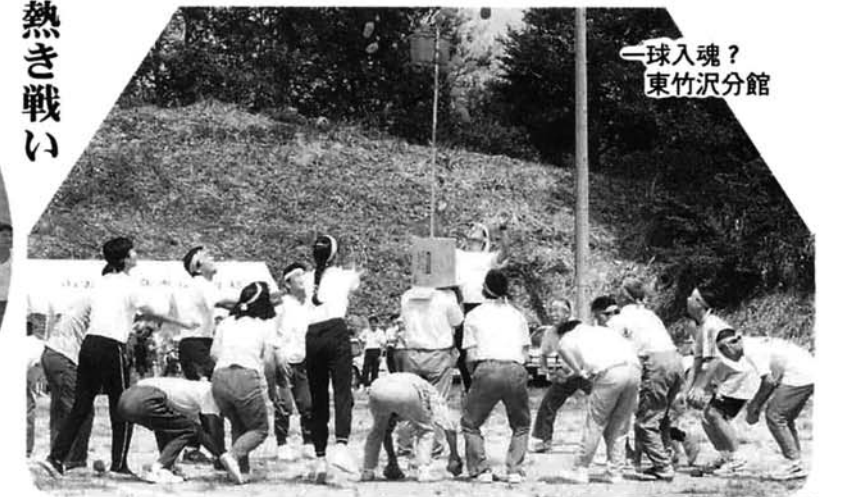
球入魂? 東竹沢分館