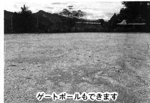
ゲートボールもできます