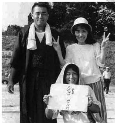
◀応援賞にピッタリ 虫亀分館