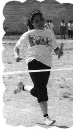
▼ヤッター・ゴールイン