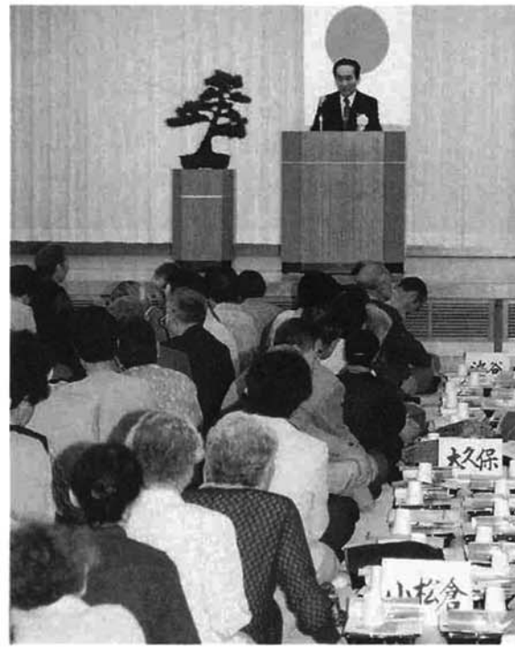
▼県知事より記念品が贈られる