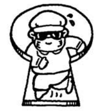
全国防犯運動 (10月1日~10日)