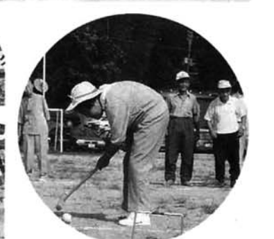
ゲートをめがけて