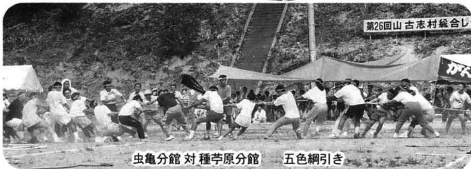
虫亀分館 対 種芋原分館 五色綱引き