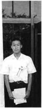
平成六年度(長岡・栞尾・三古地区)「少年の主張」大会々場

何日かたち指に激痛が走った。その日から四カ月、僕はバレーから遠ざかった。忘れもしないあの日、僕はどん