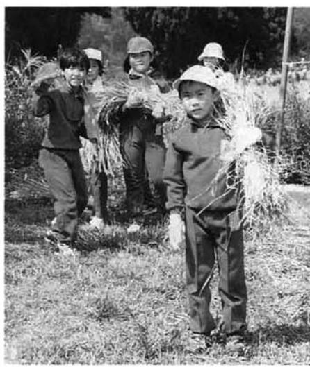
▲汗を流して頑張りました

秋晴れの九月九日、竹沢小学校の学校田で全校生徒による稲刈りが行われました。 校長先生から「稲は、三月月ちよっとで日本中の人の食べるお米が出