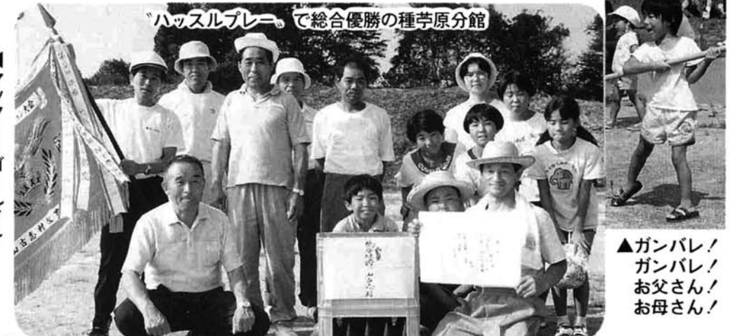
ハッスルプレーで総合優勝の種芋原分館