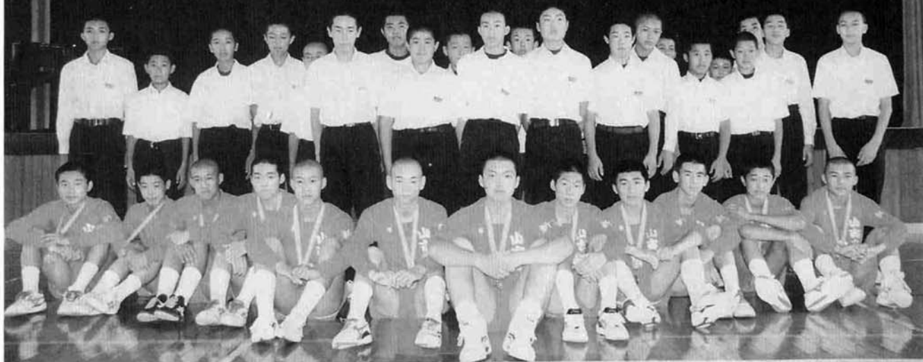
山古志中学校男子バレーボール部員

第二五回新潟県中学校選抜総合体育大会で男子バレーボール部が準優勝し、北信越大会の出場権を得ました。 山古志中の男子バレー部は、ここ数年間県大会へは出場してはいるものの上位への進出はできず、厚い壁に阻まれていました。しかし平成六年一月開催の新潟県中学校バレーボール選抜優勝大会では悲願の初優勝に輝き、以来、新潟県中学校選抜総合体育大会の優勝と北信越大会出場を目標に部活動に励んできました。 初出場の北信越大会には各県の代表一六校が参加しました。新潟県からは四チームが出場し、山古志中は部員が一丸となって「気迫のバレー」で見事一回戦を突破しました。