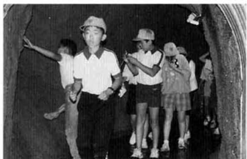
コウモリにビックリ 雪中トンネル