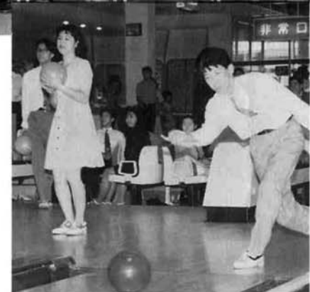
記念ポリングを楽しむ