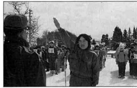
▲昨年の小学校親善スキー大会

私は仕事も含めて、年間の半分以上を、全国津々浦々のまちに出かけています。そんな旅行の途中で、電車やバスの中で隣り合わせた人に声をかけることにしています。その人のふるさとのお話を聞きたいからです。ところが、自分のふるさとを自慢して語ってくれる人は、極めて少ないのです。大きなまちに住んでいる人は、ためらうことなくまちの名をいいますが、これが小さな村だと口ごもり、近くにある大きなまちの名を答えてごまかしてしまうのです。