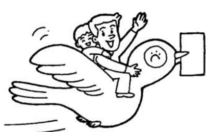
みんなそろって、きれいな一票。

村長選挙の投票方法は他の選挙と異なり、記号式投票の制度を採用しております。記号式投票の目的は、投票が簡単であり、無効投票が少ない等の