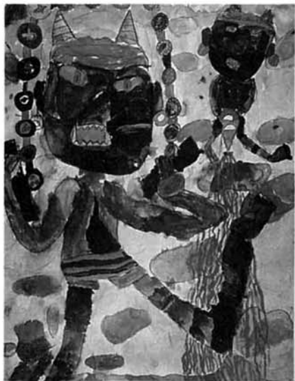
空の色をだすのがむずかかった おにのかお、手、足を書くのがめんどうでした