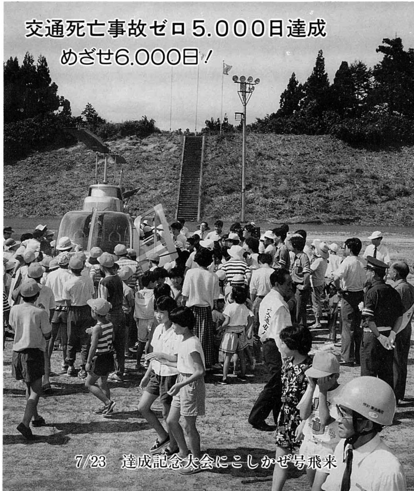
7/23 達成記念大会にこしかぜ号飛来

人口の動き ■人口 2,921人(±0) 男 1,476・女 1,445 ■世帯数 795(△1) (3.6.30現在) ■6月中のうごき □出生2 □死亡2 □転入4 □転出4