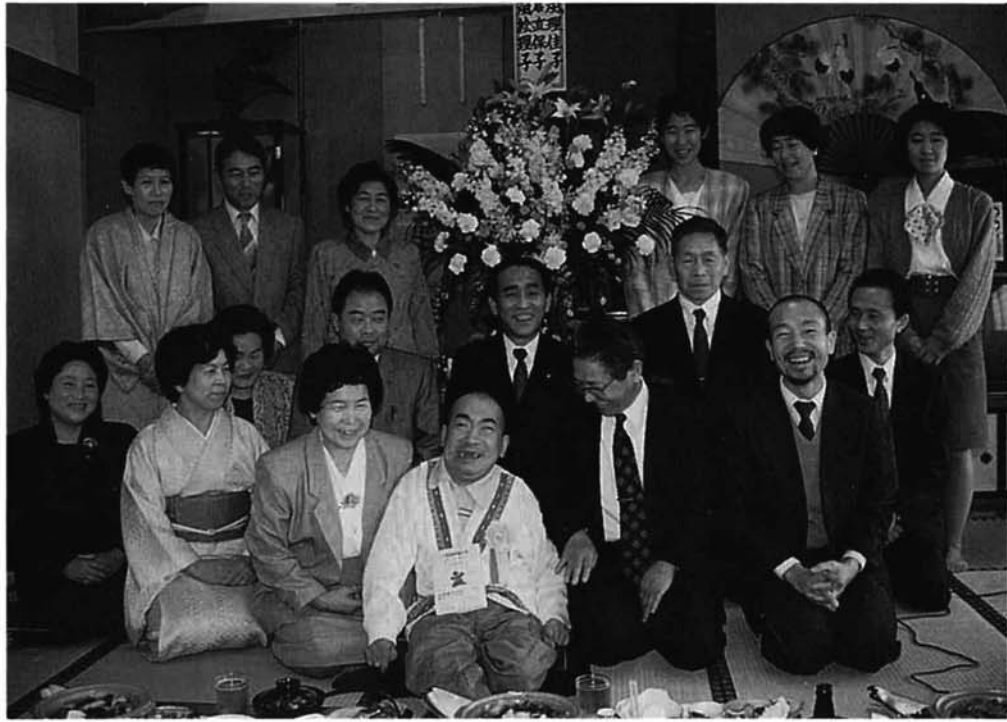
すでに、新潟日報、朝日新聞、毎日新聞等で紹介されましたが、