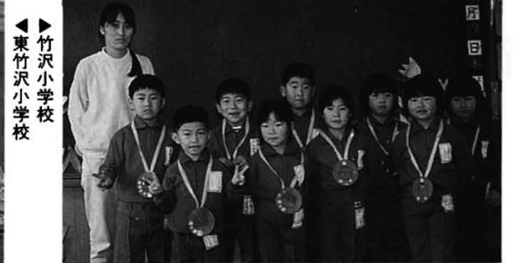
竹沢小学校 東竹沢小学校