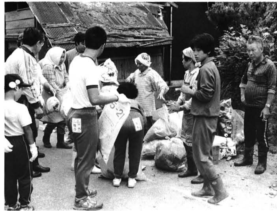
ひと汗かいた根小屋集落

六月二十八日(日)、朝六時に無 線で一斉放送された村長のかけ 声により村全体が環境美化運動 一色につつまれました。 各集落により多少内容は異な りますが朝六時から七時までの 約一時間、子どもからお年寄り まで村民約千五百人が参加して 空きかん、空きびん拾いや道路 の草刈りなどのクリーン作戦が 展開され、十トンのゴミが集め られました。 参加された方は一様に「いつ ばいあったねえ」と話をされ ました。 空きかんや紙くずなどの投げ 捨てまた、置き捨てなどをなく しみんなで地域をきれいにいた しましょう。