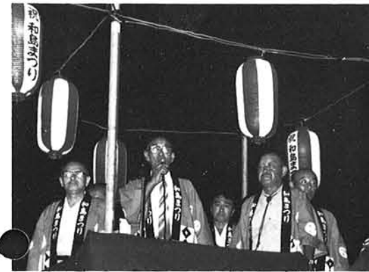
ふるさとわしま会も特別参加