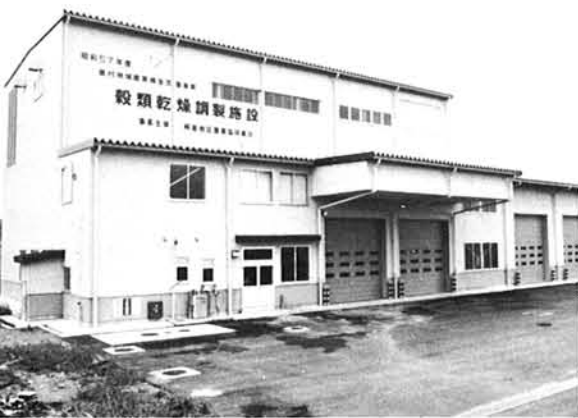
ライスセンター竣工(桐島地区農協)

昨年11月より工事が進められていた桐島地区農業協同組合のライスセンターが竣工し、8月8日に村内外の来賓多数出席のもと竣工式が挙