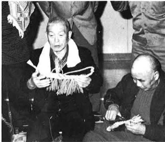
生きがい対策の推進

歳入においては、自主財源、特に税収入の増収確保に努めるとともに、特定財源の導入に努め財政秩序の確立を図ります。歳出においては、人件費をはじめとする経常経費の増この抑止に努める一方、投資的経費の充実を図り、財源の重点的な配分と経費支出の効率化に徹した健全な財政運営に努めます。