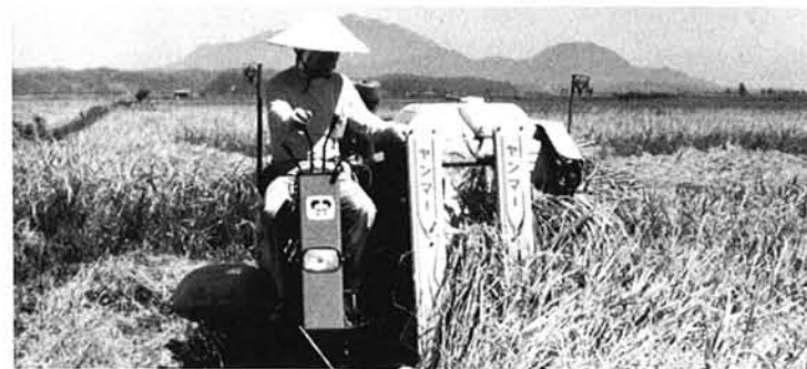
安定した農業経営を目指して

金融対策及び商工業経営診断事業を導入し、経営改善を図り、特色と活気ある近代的商店街づくりを進める一方、工場適地、農村地域工業導入地区の見直しを図り、新規の工業団地の造成を図ります。