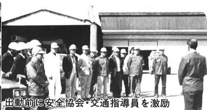
出動前に安全協会・交通指導員を激励