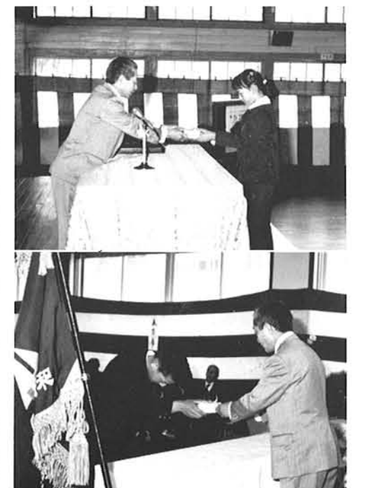
小中学校に反射テープを寄贈