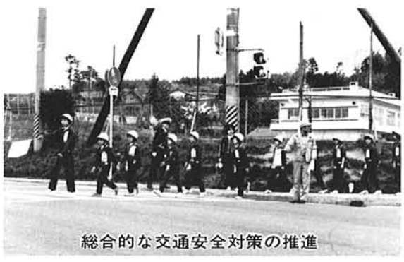
総合的な交通安全対策の推進

自然環境の保全や、快適な居住環境の整備にとって、下水道事業の推進が重要であり、特定環境保