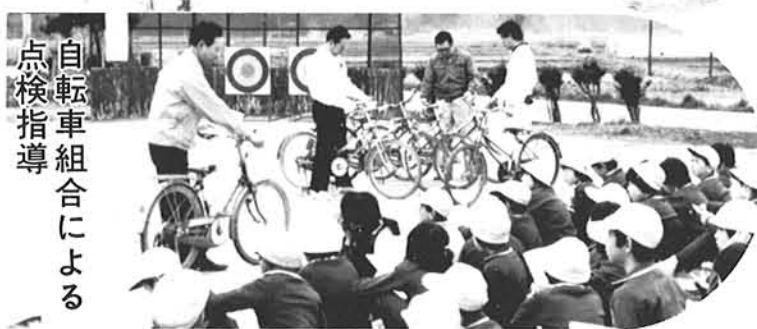
自転車組合による点検指導