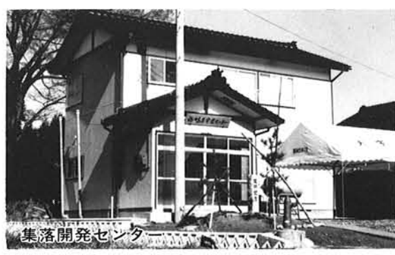
集落開発センター

○コミュニティの推進 社会経済の変化に伴い、地域における個人の連帯感やつながりが弱まってきており、「住みよい地域社会をつくるために、地域の一人一人が自ら行動して問題を解決していく連帯感ある人々の集まり」を推進します。