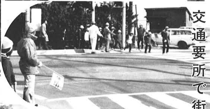
交通要所で街頭指導