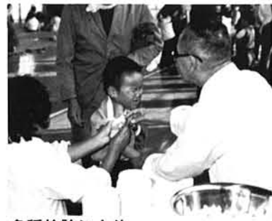
各種検診により 疾病の早期発見・早期治療を推進

老人の健康増進、教養の向上、生きがい対策の推進のため、老人憩いの家や生きがいルーム等老人福祉施設の整備を促進する一方、寝たきり老人や、ひとり暮らし老