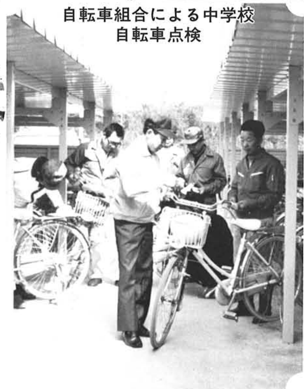
自転車組合による中学校自転車点検