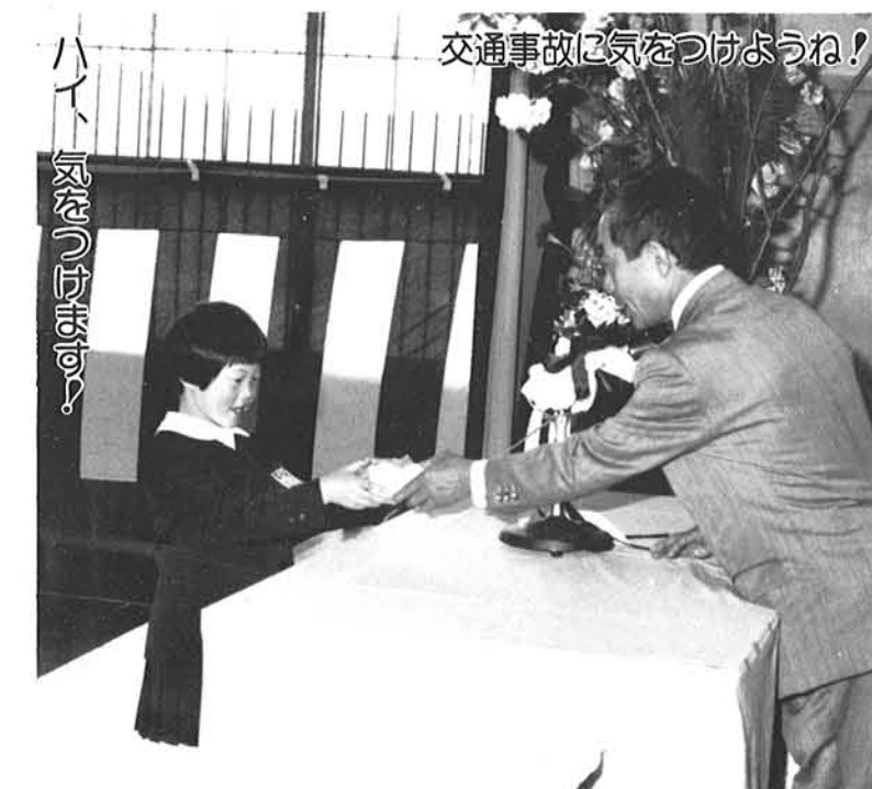
交通事故に気をつけようね!

去る四月六日から十五日までの全国交通安全運動が行なわれ、和島村に於きましても警察・安全協会・交通指導員・各小中学校の先生・役場と村全体が一丸となつて悲惨な交通事故を無くしようとこの運動に取り組みました。関係者の皆さん大変御苦労様でした。