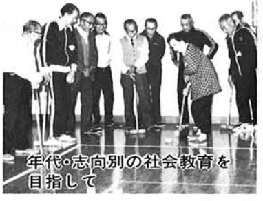
年代・志向別の社会教育を目指して

健全な地域社会づくりを目指す社会教育の果たす役割は極めて大きく、このため、年代別、志向別等、各階層に対応した学習機会の拡充と活動意欲の助長、施設整備を進めます。