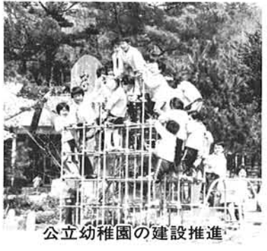
公立幼稚園の建設推進

全公共下水道整備事業及び農村総合整備モデル事業等の採択による全村下水道整備を進めます。