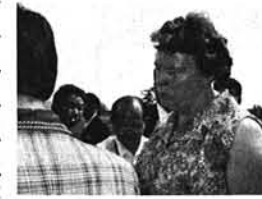
▲ 酪農家の主婦に聞く (オランダ)

オランダの国土は大きな水槽の中にタツプり浸し之をゆすって平にした感じの何処迄も続く地平線それを青々とした牧草や作物で覆う農地、その中に点在する農家と森林、のどかな牧生畑地、花の国オランダという印象が強い。食品工業と農業が国の主産業であり農