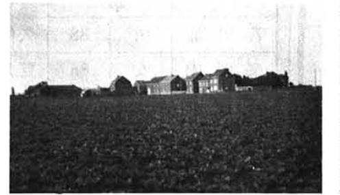
▲ 畑作地帯に散在する農家 (ベルギー)

救済にも意を尽くしているが、為国費が増大して検討を迫られている現状ときく。政府予算は赤字に苦しむ国民自身は潤沢な所得に恵まれているという。国民は善良なものという評がある。なだらかな斜面による起伏のある農地が多く見られオランダとは少し違った風景となっている。国の主産業は製鉄業と運輸業を中心とした第三次産業が花ざかりのようである。車輦生産工場のないこの国では、専ら外国産の車にたよっているのであるが、国全体の二十五%を日本車で占めており、ベルギーを経由してフランスへも日本車が入っており技術、価格、アフターサービスのとれをとつても欧州各国に勝っていることである。訪れた農家に新旧二代(台)のマツダが入っているなつかしい気持ちにさせられた。