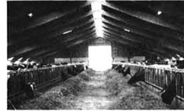
▲ 牛舎内 (オランダ)

福祉政策の国ベルギーの証しがごとく知らされる。アウトバイン(自動車道)にきれいに林立する照明灯は欧州何れの国にも増して質量ともに整備されている。交通事故の