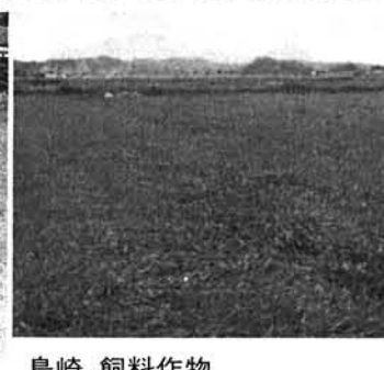
島崎 飼料作物 (イタリアンライグラス)

今年で四年目を迎えた水田利用再編対策(転作)は、村に配分された目標面積32.1haに対し、先般第一回目の転作実施確認が終了した訳で、もっかその集計が行われているところだ。 転作実施計画の内容を見ますと飼料作物が一番多く、一般野菜、保全管理、大豆、麦、永年性作物というところだ。 なお、転作の集団化を推進した結果、島崎部では、飼料作物と麦を9.9ha、両高部では、大豆と麦を5.7ha集団転作する計画です。