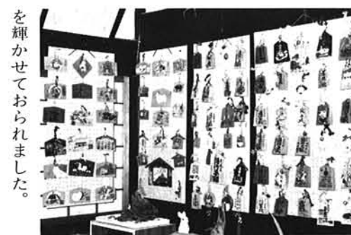
を輝かせておられました。

〇羽鳥コレクションについては、 左記の日時でテレビ放送されま すので御視聴下さい。 七月六日(月)午後六時四〇分 NHK 「いがた六四〇」