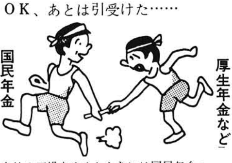
OK、あとは引受けた... 厚生年金など 会社や工場をやめたときには国民年金へ...

いまわが国には、公的年金と呼ばれる八つの年金制度があります。会社や工場に勤める人は厚生年金、船員は船員保険、公務員または公社などの職員は各種共済組合、農業や自営業などに従事する人は国民年金...というように、すべての国民がその職業によっていずれかの年金制度に加入し、年をとったときや万一の場合には、所得保障される。国民皆年金の体制ができていくわけです。