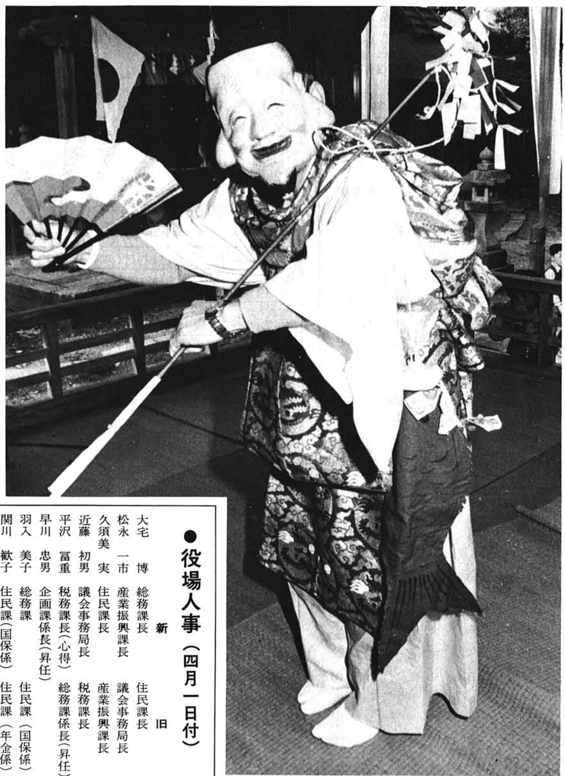
(四月十五日、島崎宇奈具志神社にて)