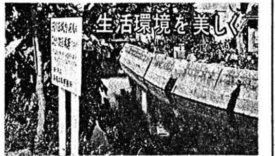
生活環境を美しく