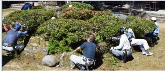
園内の整備が行われ、地域内外から老若男女が4日間で延79人参加しました。 (6月15・16・25・26日)