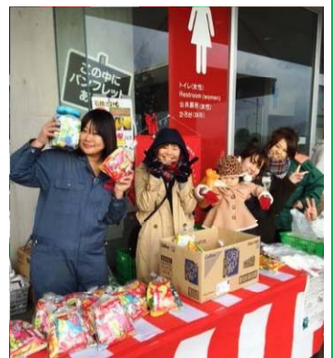
クリスマスイベントでの様子 新メンバー随時募集中！