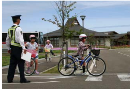
▲和島幼稚園・保育園(5月10日)