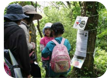
▲所々で三択クイズに挑戦！