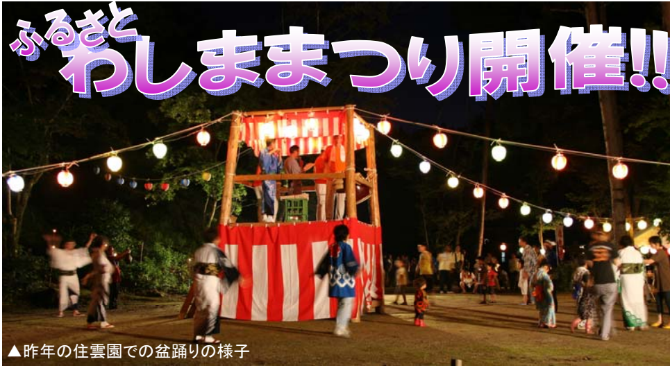
▲昨年の住雲園での盆踊りの様子

長岡市和島支所地域振興課 地域振興・防災係 第45号/平成22年7月25日発行 〒949-4511 長岡市小島谷 3434-4 TEL(0258)74-3111 FAX(0258)74-2791