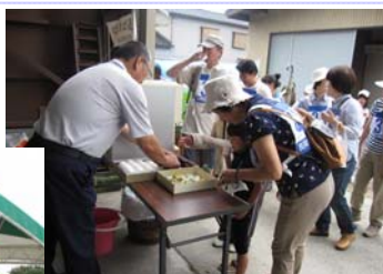
▲良寛ゆかりの地をめぐる「まちの駅ウォーキング」には50名の方が参加！