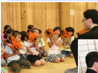
▲小鼓の打ち方を体験 地謡の練習中→