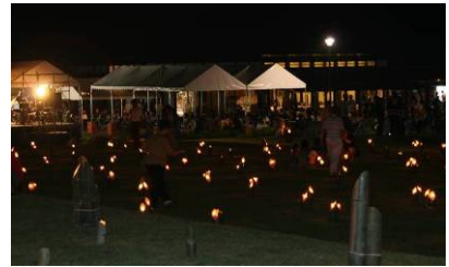
▲コンサート会場 ▼琴としの笛のコンサート