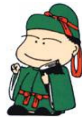
和島地域生涯学習 キャラクター

去る七月九日（月曜日）から十三日（金曜日）「第二十四回ナイターバレーボール大会」が和島体育館を会場に行われました。結果は次のとおりです。