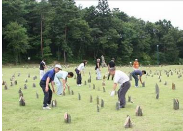
▲ボランティアによる竹灯ろう配置作業の様子

まつりに訪れた家族連れは、「地震で家が壊れ、土地に亀裂が入ってしまった心配です。でも心配ばかりしていては仕方がない。気分転換になったし、今夜は思い切って出かけられて良かったです。」と話していました。