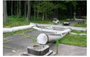
▲鹿島神社の鳥居倒壊

7月16日10時13分頃、上中越沖深さ17kmを震源とするマグニチュード6.8の「新潟県中越沖地震」が発生しました。和島地域の最大震度は、同日15時37分に記録した「6弱」。地域全体で断水し、家屋や地盤に大きな被害を受けました。被災された皆様に、心よりお見舞い申し上げます。