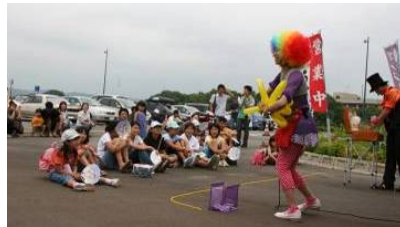
▲▼昼間は、まつりにあわせ、大道芸や人権擁護委員による人権啓発活動も行われました。