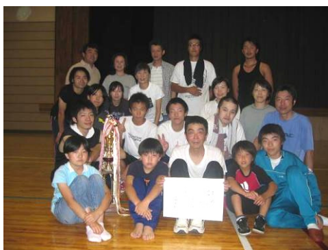
▲写真は優勝チーム 優勝：ひまわりチーム(両高) 準優勝：村田チーム 三位：下町上チーム

去る七月九日（月曜日）から十三日（金曜日）「第二十四回ナイターバレーボール大会」が和島体育館を会場に行われました。結果は次のとおりです。