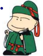
和島地域生涯学習キャラクター なまむし麻呂くん

当日は、道の駅もてなし家前の「芝生広場」を出発し、目的地の山田海岸に着いたものの、強風のため、急ぎよ来た道に戻るハプニングがありました。往復七キロを歩いたあと、芝生の上で豚汁を食べました。腹ごしらえをした子供たちは続いて宝さがしに挑戦！海岸での宝探しとは違い、あみだくじの発想を活かした「あみだ宝探し」でお土産を獲得した後には、体育指導委員の新企画、凧揚げを体験しました。委員手作りの凧に子供も大人も一緒に楽しみました。突然のコース変更でしたが、皆さんのご理解をいただきました。ご協力くださった皆さんには心から感謝申し上げます。ありがとうございました。