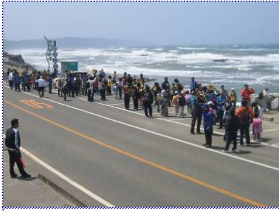
▲強風のため、残念ながら、海岸での昼食やレクリエーションは中止。140名の参加者は波の高さに驚いていました。